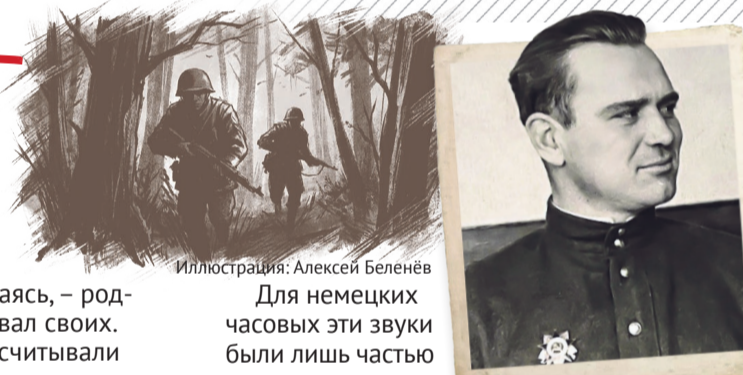
Иллюстрация: Алексей Беленёв

Внезапно в лесу на правом берегу раздался короткий вскрик совки. Ей тут же с противоположной стороны глухо ответил филин.