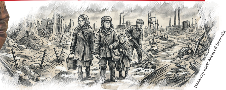
Иллюстрация: Алексей Болотнев

Сама-то Лидия не видела – соседи рассказывали дрожащим шепотом.