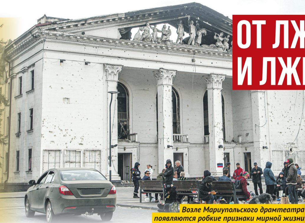
Возле Мариупольского драмтеатра появляются робкие признаки мирной жизни