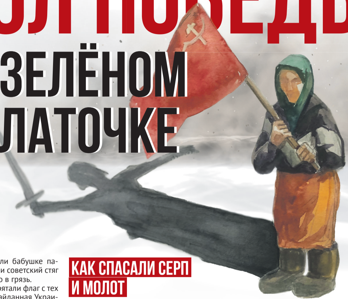
Рисунок Елены Рябоваловой, коллаж Алексей Беленёв