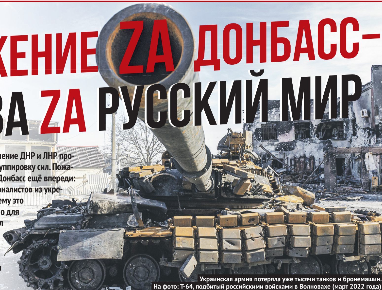
Украинская армия потеряла уже тысячи танков и бронемашин. На фото: Т-64, подбитый российскими войсками в Волновухе (март 2022 года)