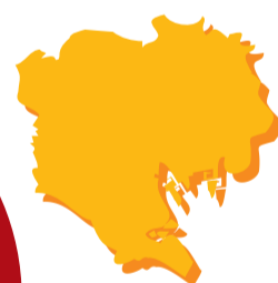
Инфографика: Алексей Беленёв