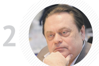
2 Комитет ГД по делам национальностей ГЕННАДИЙ СЕМИГИН