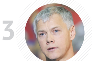
3 Комитет ГД по защите конкуренции ВАЛЕРИЙ ГАРТУНГ