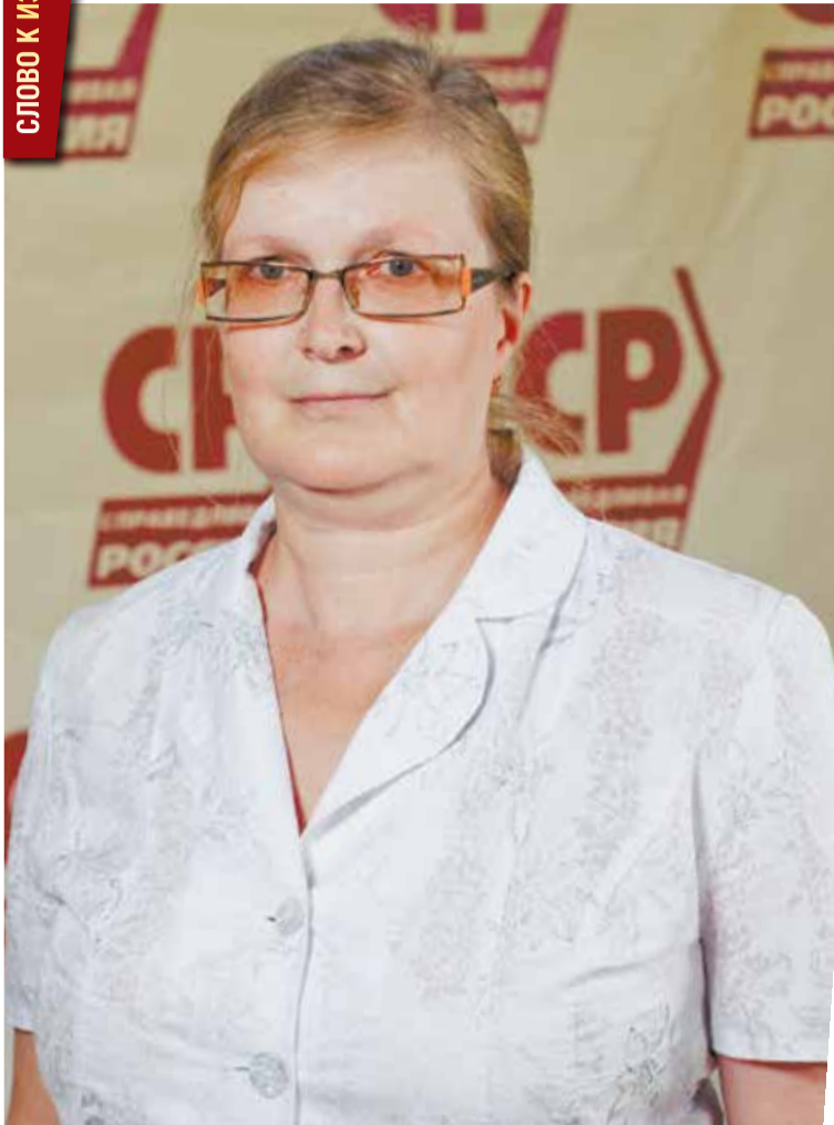
Уважаемые жители Заводского района! Земляки!

Сегодня нам по несколько раз в день с экранов телевизоров городские власти рапортуют о том, что отремонтированы очередные участки дорог и каким замечательным и прочным является дорожное покрытие, и что мы с