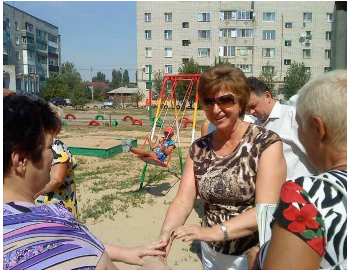
Открытие детской площадки в Балашове по ул. Красина

учебному году». В рамках ее проведения оказывается материальная помощь по приобретению школьных принадлежностей: в поселениях Балашовского района помощь была оказана 37 школьникам на общую сумму 11 400 рублей, в поселениях Романовского района — 32 на общую сумму 98 000 руб.