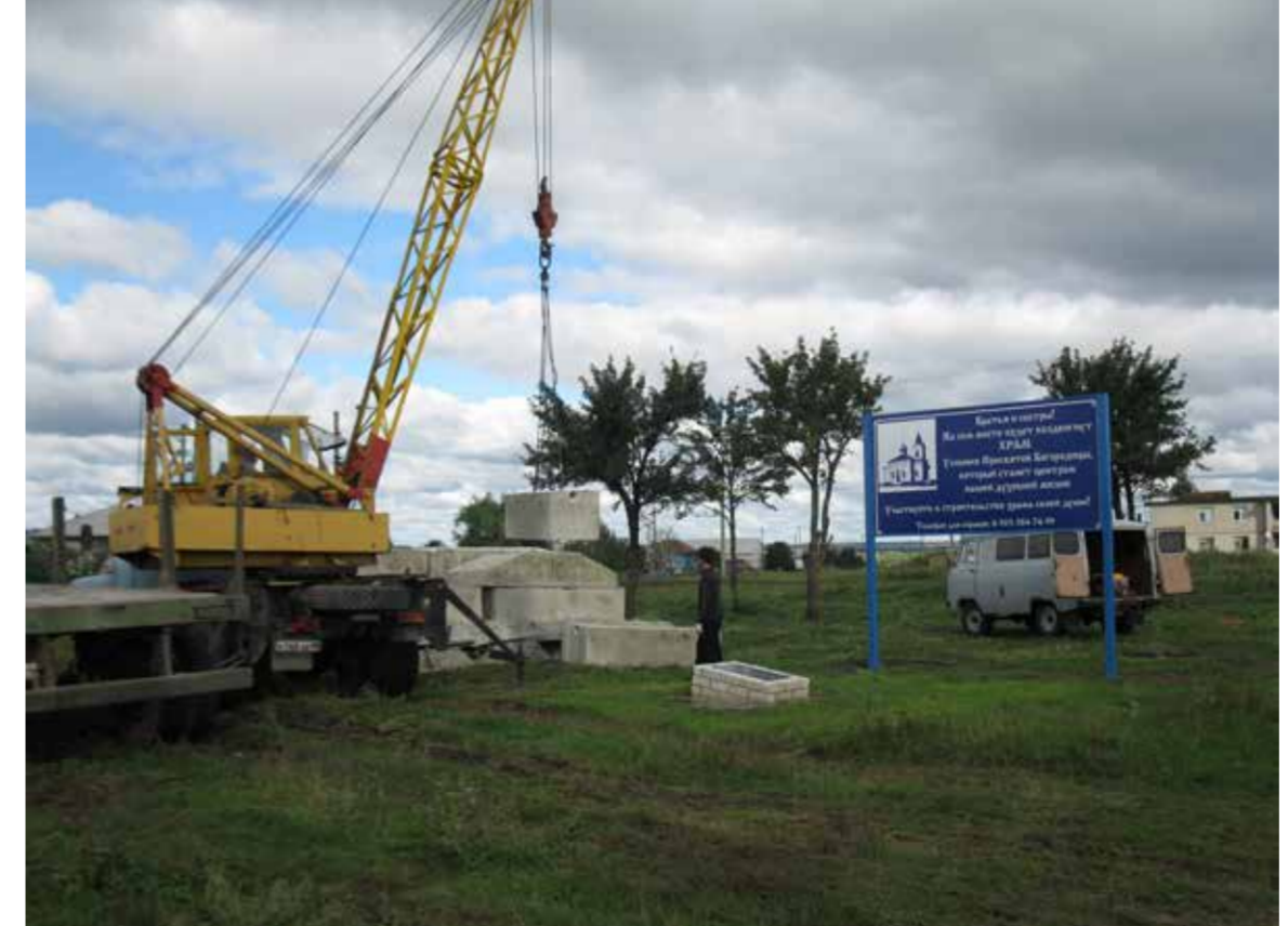
Закладка храма в Старом Хопре