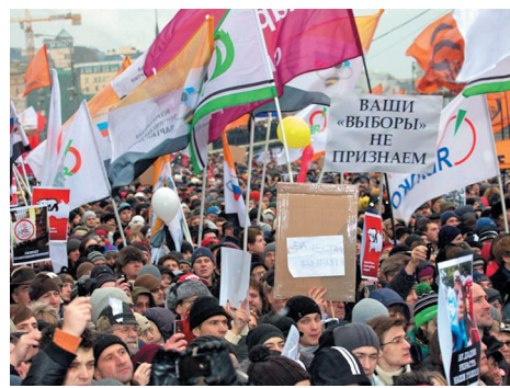
Митинг протеста на Болотной площади в Москве

– Председатель партии поблагодарил нас за сильную, грамотную избирательную кампанию и достигнутый резуль-