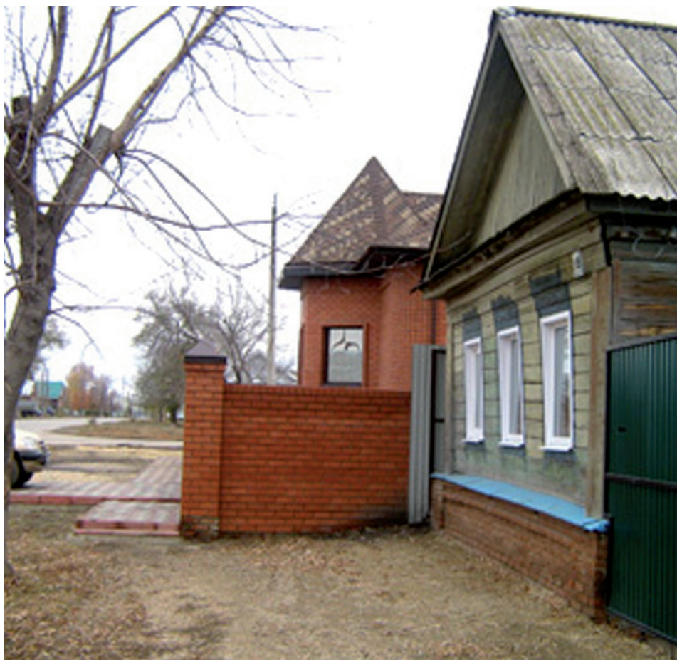
Тротуар с препятствиями у дома №329 по ул. Красноармейской г. Пугачева