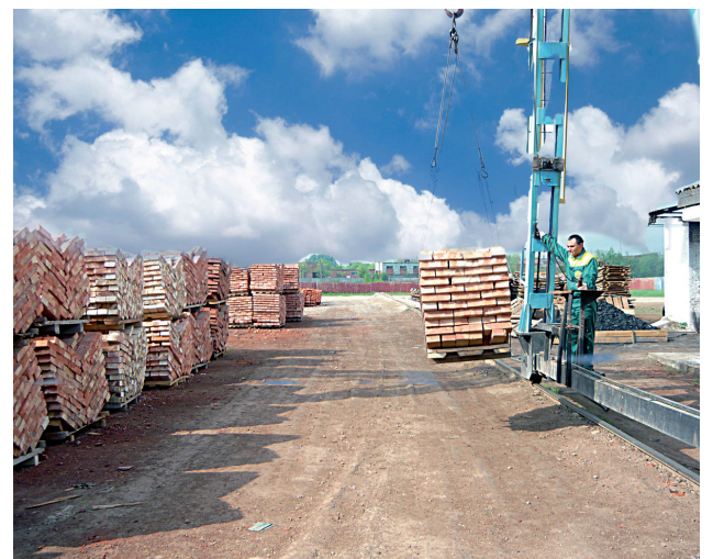
Склад готовой продукции кирпичного завода