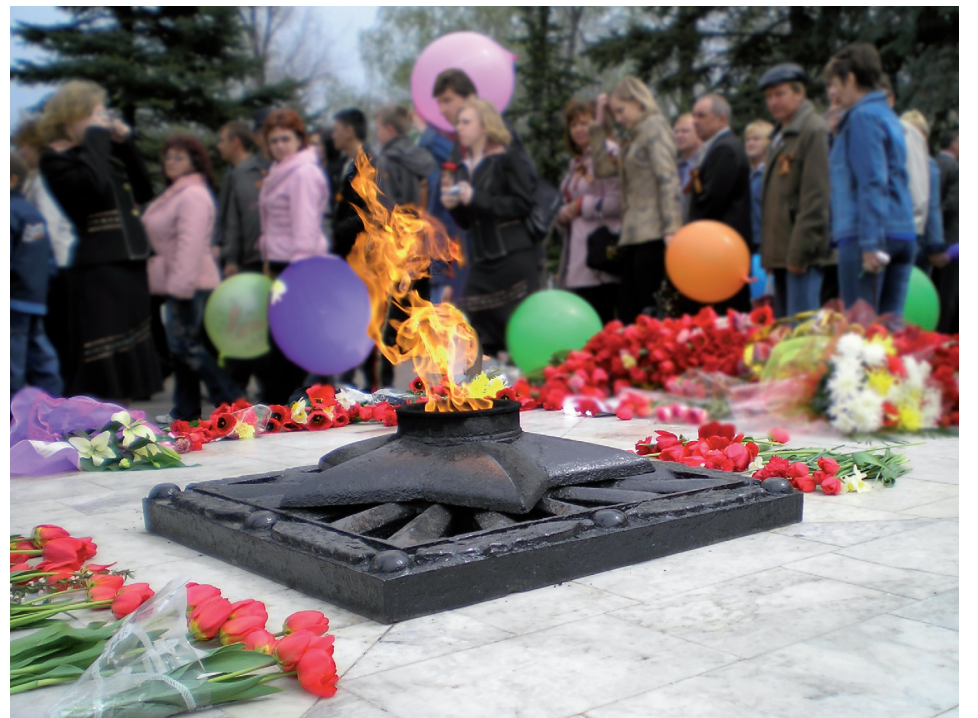
Вечный огонь в пугачевском сквере Победы

СПРАВЕДЛИВАЯ РОССИЯ № 1 в ИЗБИРАТЕЛЬНОМ БЮЛЛЕТЕНЕ