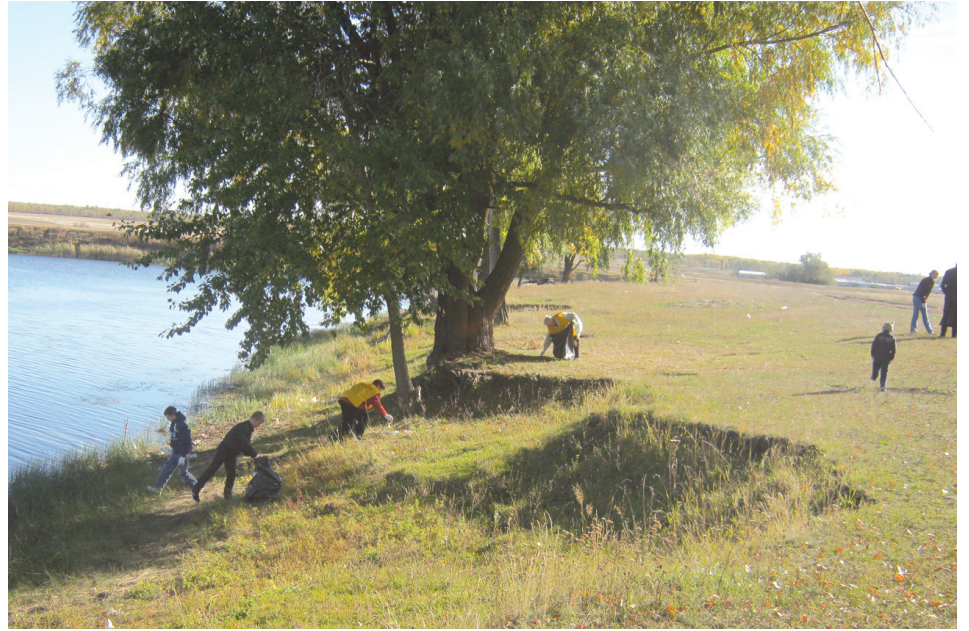
В День города справедливороссы провели субботник

Все стремились, не сбавляя темпов, внести свой посильный вклад в общий подарок городу – как можно лучше и чище убрать отведенную территорию левого берега пруда к будущему году.