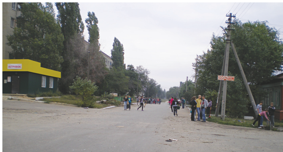
К вечеру молодежь Аткарска выходит на улицы, но заняться ей практически нечем, зато призывно открыты двери многочисленных магазинов с горячительными напитками

Обилие алкогольной продукции в продуктовых магазинах и относительная ее дешевизна также подталкивает подростков к употреблению алкоголя. Положение усугубляют магазины, где погоня за выручкой затмевает всякую мораль, ведь от нее зависит заработная плата продавца. Вот и продают практически безнаказанно сигареты и алкоголь детям. Да и сами магазины в большинстве случаев расположены в непосредственной близости от школ и детских садов. Разнообразные коктейли, которые