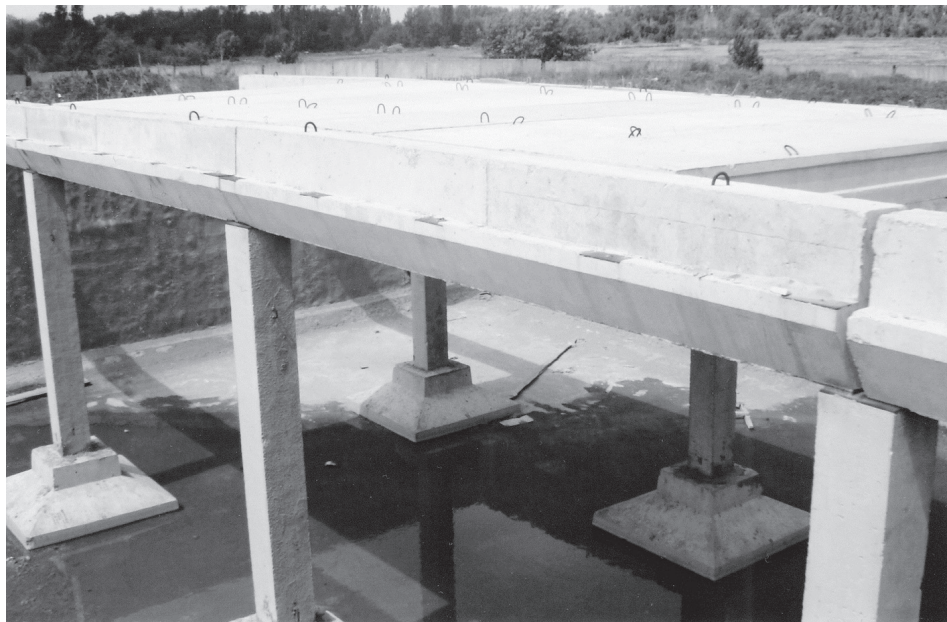
Здание и бетонный резервуар водозабора не законсервированы и постепенно разрушаются

Экономия. Мы не видим стремления у муниципальных чиновников экономить на себе. Больше того, если посмотреть на