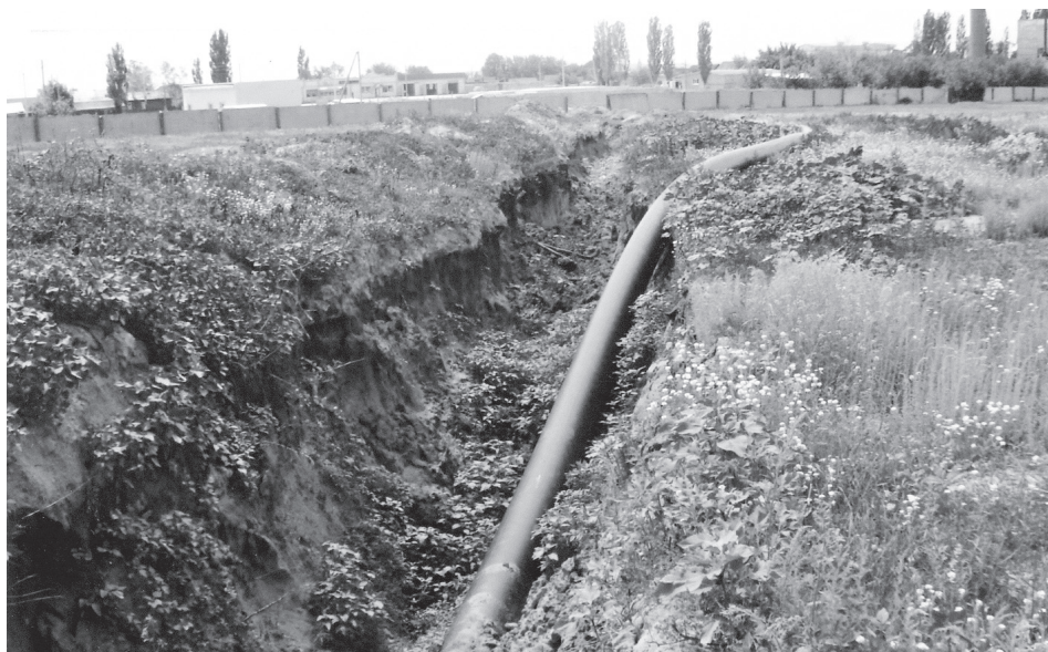
Строительство Аткарского городского водозабора ведется с 2008 года, но до сих пор ему не видно конца

Вторая задача – это экология. Как и водозабор, заморозилось строительство очистных сооружений. Не перестает гореть городская свалка бытовых отходов. При этом средства на правильную утилизацию отходов, строительство подъездной дороги, санитарную обвалов-