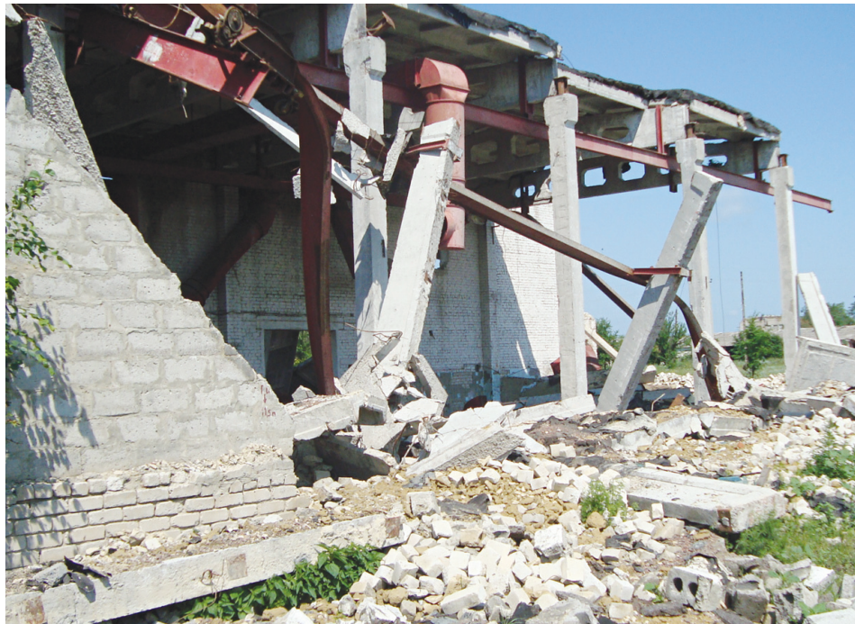
Полуразрушенный мехток в с.Елизаветино

Именно рейдерский захват предприятия в августе 2007 года, по мнению елизаветинцев, стал началом конца ГУОПП «Елизаветинское» НИИСХ Юго-Востока. Да, были долги, соглашались люди, но они работали и были, очевидно, варианты выхода из сложившейся ситуации. Но говорить о какой-либо поддержке в то время со стороны администрации района елизаветинцы не могут. Наоборот, сообщается в письме, чинились всяческие препятствия,