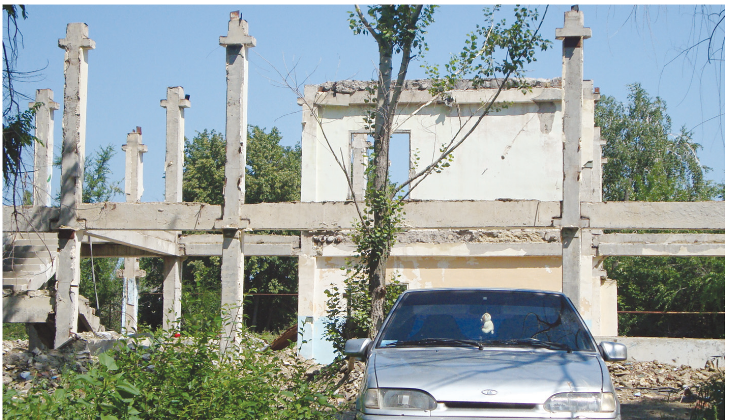
Разобранный до основания двухэтажный детский сад в с.Елизаветино