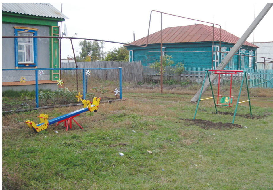
Двое качелей, установленных депутатом-справедливороссом А.П.Кучменко совместно с жителями улицы Транспортной г.Аткарска

Не оставляют без внимания эти депутаты и детские сады. Для двух детсадов депутатами-справедливороссами были куплены и установлены электрические водонагреватели. А в центр социального обслуживания населения для активных бабушек и дедушек депутаты-справедливороссы подарили концертный баян высокого класса. Сколько веселых, задорных песен и частушек будет теперь спето фольклорной группой на радость всем аткарчанам!