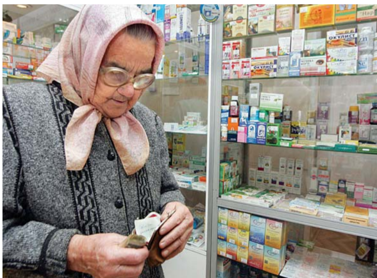
Когда старики покупают лекарства на последние деньги, мы им должны помочь. Но когда им пытаются продать «приборы» от всех болезней, мы обязаны их защитить

Пенсионеры Саратовской области подвергаются атакам торговых агентов