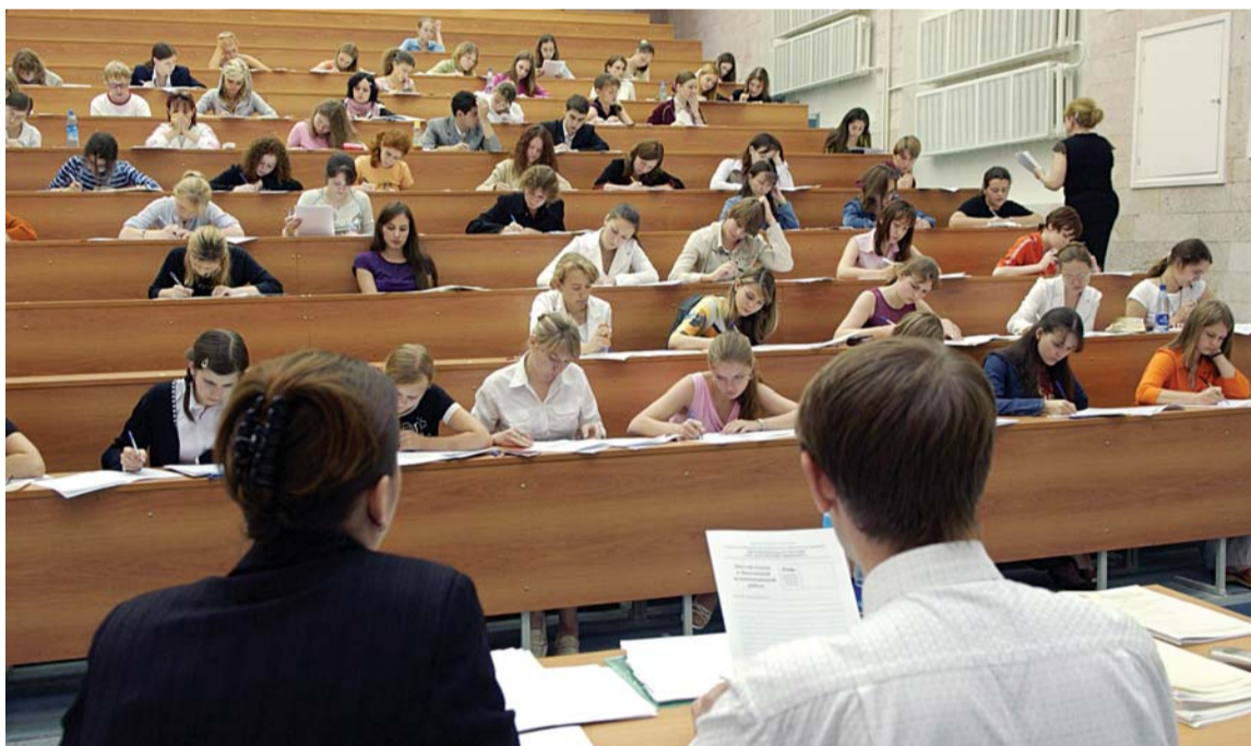
Образование, здоровье, социальные гарантии всем категориям граждан — задача государства, а не придумывание новых идеологических утопий

Один из главных идеологов правящей партии Андрей Исаев пояснил, что едроссы понимают под консерватизмом: «В то время как оппоненты слева борются за интересы одного класса — класса трудящихся, оппоненты справа борются за успех отдельной личности, мы выступаем за успех российского народа как единого целого».