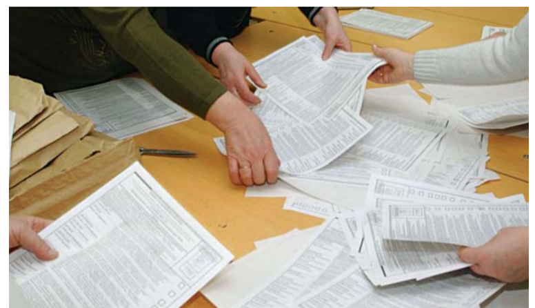
Если Вольский эксперимент понравится единороссам, то незачем будет устраивать такие пустяковые формальности как выборы