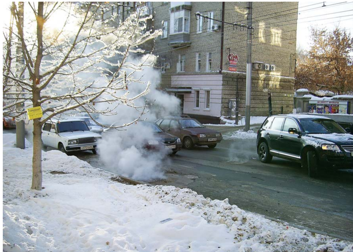
Пробки, сугробы, прорывы теплосети — признаки зимы в Саратове

— Город постоянно жалуется на отсутствие дворников, техники, денег... чего угодно.