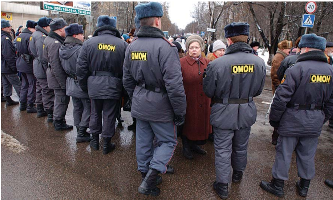
Конституционное право граждан на митинги и шествия снова под вопросом?

В Государственную Думу внесены законопроекты, усложняющие возможность гражданам выражать свое недовольство бездействием власти