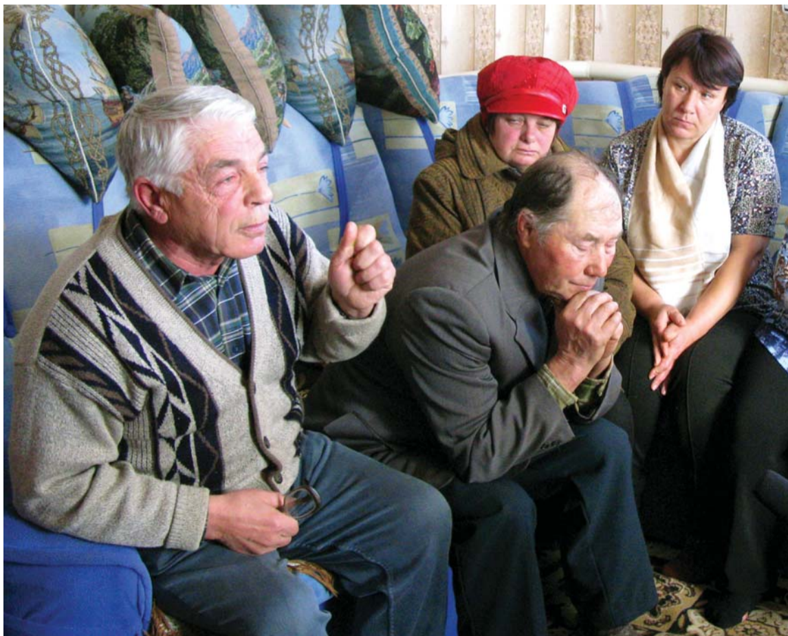
Жители Малой Осиновки: «Мы бы никогда не выбрали такого главу!»