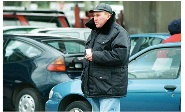
Российские автомобилисты едва не стали жертвами нового транспортного налога

Представители оппозиционных партий сразу же принялись критиковать возмутительную, по