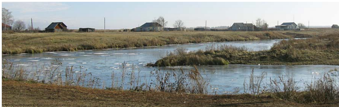
Когда-то в Осинке было цветущее хозяйство