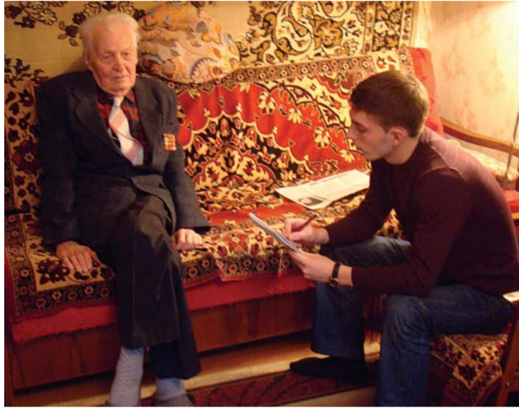
Иногда старикам важно просто пообщаться

Понятно, что любые дела, особенно добрые, лучше делать сообща. Поэтому «соколы» обратились в общественное движение в поддержку семьи, материнства и детства «Лучик надежды». Его участ-