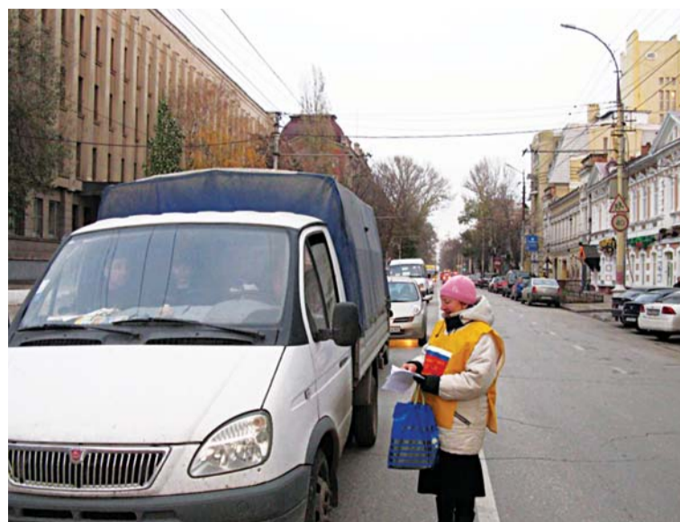
Пикет СПРАВЕДЛИВОЙ РОССИИ на улицах Саратова