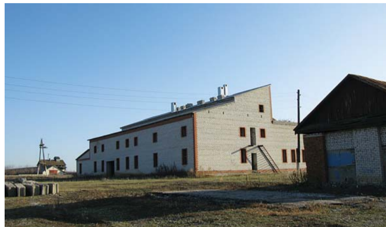
Молочный комплекс так и остался недостроенным