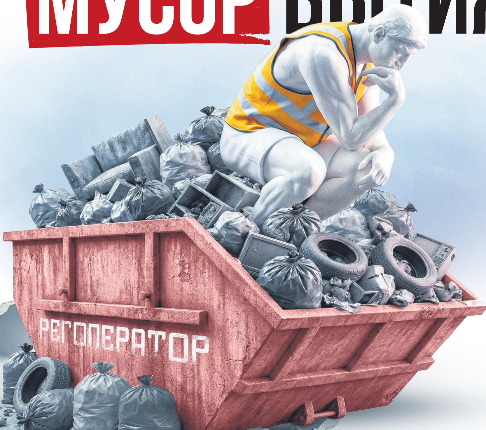
Иллюстрация: Алексей Беленёв

Пока одни регионы внедряют новые технологии и стремятся переработать как можно больше отходов, Саратовская область застряла в мусорном средневековье. Почему наш регоператор, который позабыл дорогу к контейнерам, до сих пор не отправился на свалку истории? Как мусорная реформа превратилась в банальную чистку кошельков саратовцев и какие шаги помогут исправить ситуацию?