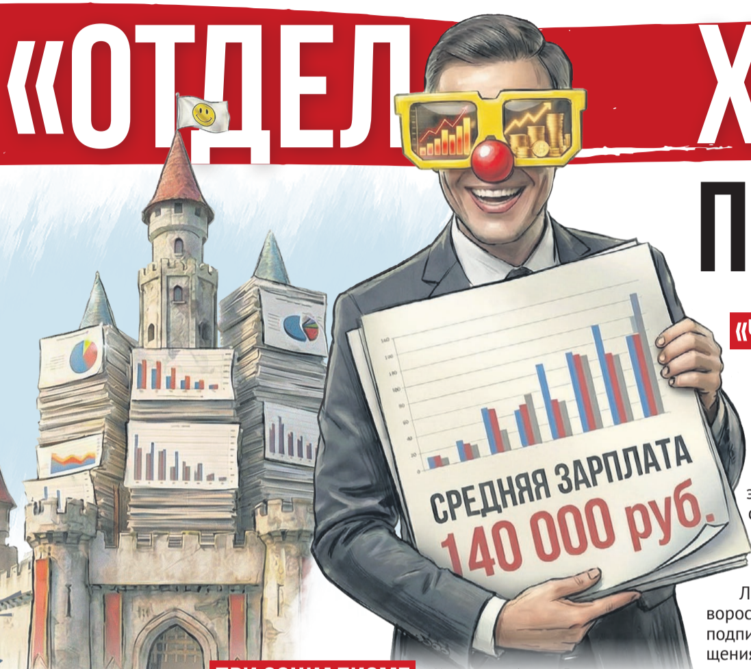
Иллюстрация: Алексей Беленев