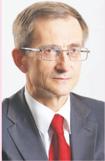
Председатель партии СПРАВЕДЛИВАЯ РОССИЯ, Заместитель Председателя Государственной Думы Николай ЛЕВИЧЕВ:

– В начале декабря исполнился ровно год с начала работы Государственной Думы шестого созыва. Прошедший год для Госдумы в целом был напряженный, даже нервный, но в то же время он заложил новые перспективы. Стало понятно, что политическая